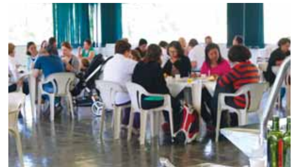
Equipe de Comunicação