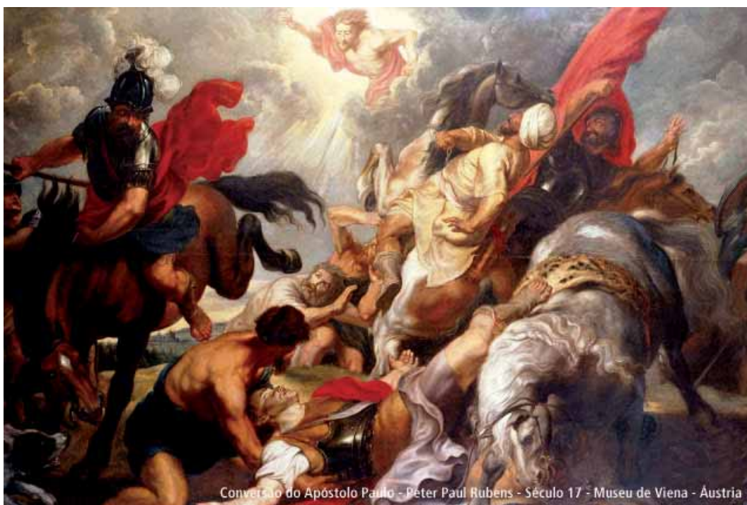
Conversão do Apóstolo Paulo - Peter Paul Rubens - Século 17 - Museu de Viena - Áustria

céus abertos e o Filho do Homem, o Cristo, aí reinando, domina a vida toda do Apóstolo dos gentios, Paulo de Tarso. Além das grandes e contínuas viagens apostólicas e das prisões e sofrimentos por que passou, devemos ao nosso Patrono, que se auto denomina "servo de Cristo", a revelação da mensagem do Salvador, ou