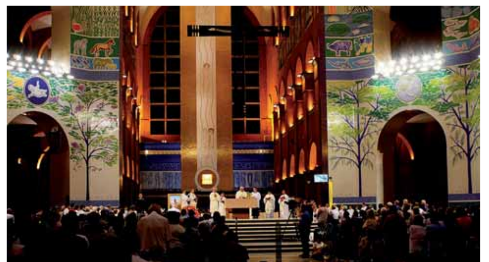
Sábado - Missa as 18 horas

Os Legionários tiveram o horário vago até as 16h30min para almoçarem e visitarem os lugares de seu interesse na cidade de Aparecida, as 16h30min conduzido pela Regia da Baixada Fluminense/RJ tivemos a concentração na tribuna Bento XVI, os grupos juvenis da Regia nos apre-