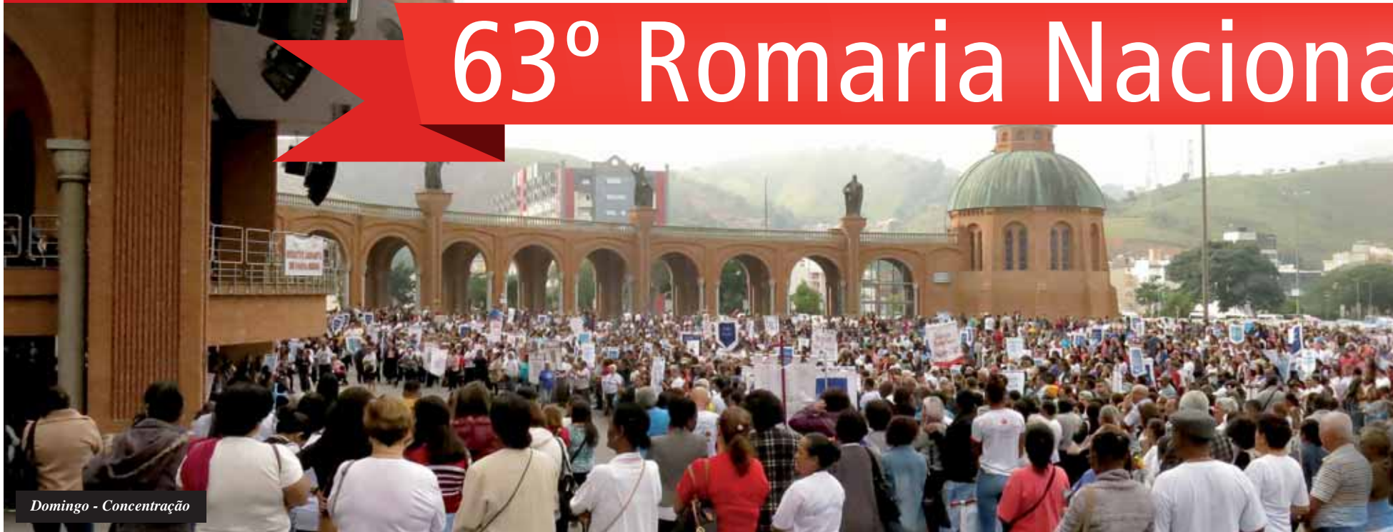
Domingo - Concentração