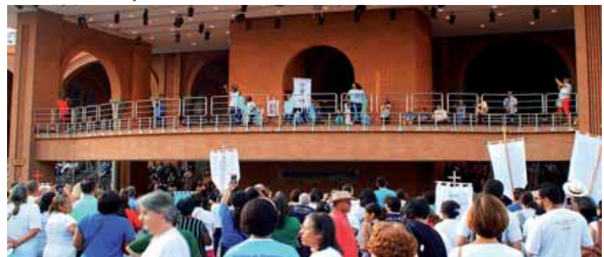
Sábado - Animação, apresentação de Grupo de Jovens