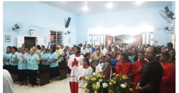
Missa de São José e encerramento da PPC