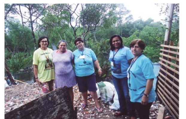
Visita às famílias no Mangue.