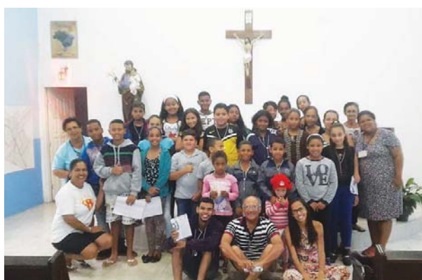
Catequese com as crianças da comunidade

Visitamos lares, comércios, lojas e oficinas, num total aproximado de 1220 famílias e muitos contatos de rua.