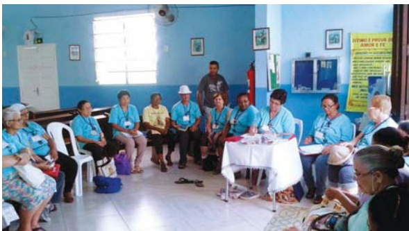
Reunião dos PPCistas

Os nossos dias se iniciavam às 07h00 e terminava às 21h00 com a reza do ofício divino das comunidades.