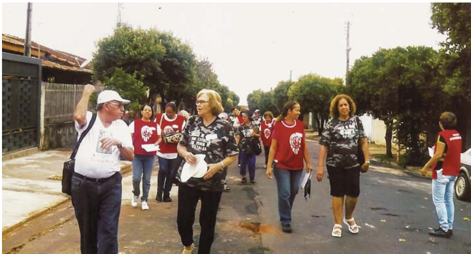
Foto da PPC de São José do rio Preto em São Paulo