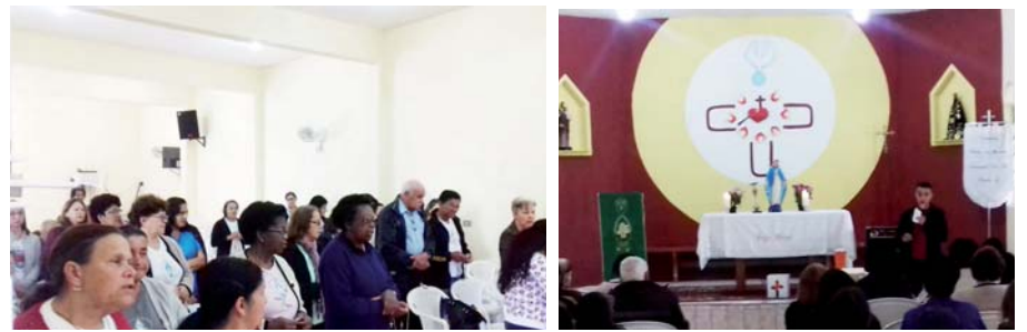
Foto da nossa formação de oficiais de Praesidias, que aconteceu em 21/10/18, na comunidade São José.