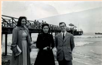
Afonso Lambe no Peru

Hoje, enormes preparativos estão sendo feitos em comemoração pelo 60º aniversário de falecimento de Alfie Lambe, que será comemorado em janeiro de 2019, em Buenos Aires. Em agosto de 2018, o Senatus de Buenos Aires enviou um convite ao Concilium pedindo que um delegado fosse enviado para essas comemorações. Há a confirmação de que haverá presença de oficiais dos Senatus e conselhos superiores da maioria dos países sul-americanos. Os legionários presentes terão várias sessões sobre questões Legionárias.