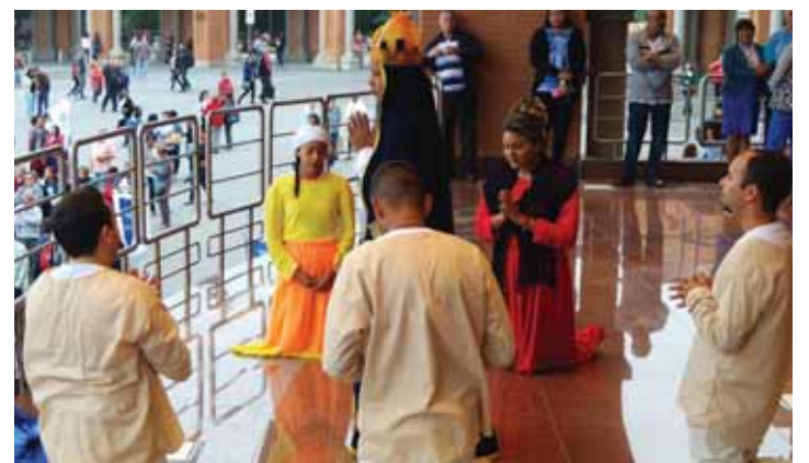
Apresentação do grupo de teatro - Domingo

No sábado de manhã, o que se viu foi uma multidão legionária concentrada em frente à matriz da Basílica de Nossa Senhora (igreja antiga), que seguiu em procissão, rezando e cantando, ao morro do Cruzeiro para a meditação da via Sacra.