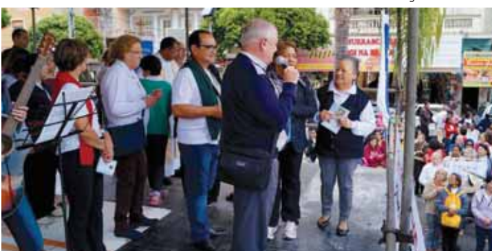
Ofício de Nossa Senhora - Sábado