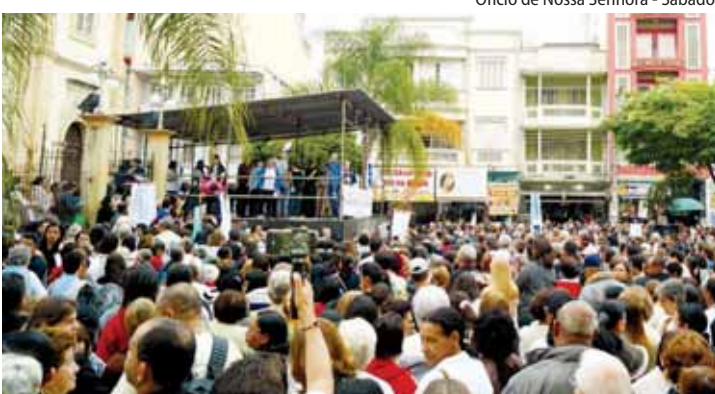
Ofício de Nossa Senhora - Sábado