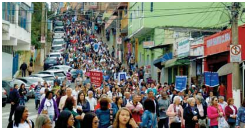
A Caminho da Via Sacra no Morro do Cruzeiro - Sábado