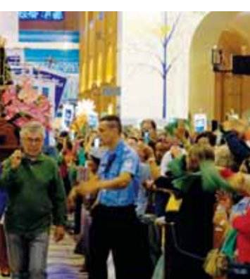
Nossa Senhora Aparecida rumo a procissão - Sábado