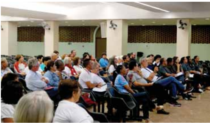
Reunião dos Senatus e Regiae - Sexta Feira