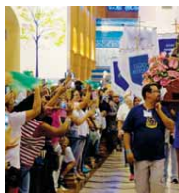
Saída do Santuário com a imagem de No

A nossa tradicional romaria ao Santuário de Nossa Senhora Aparecida, no primeiro fim de semana do mês de junho, foi um sucesso.