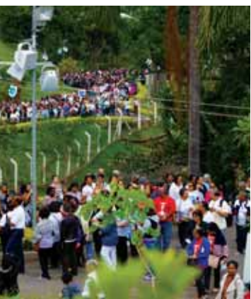
Via Sacra no Morro do Cruzeiro - Sábado