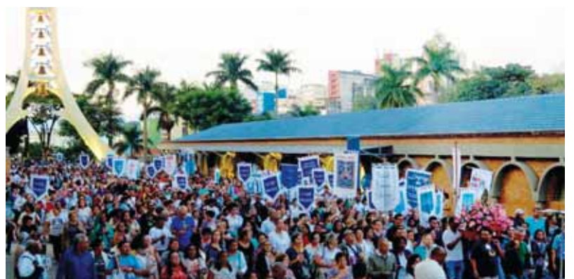
Procissão com a imagem de Nossa Senhora Aparecida - Sábado