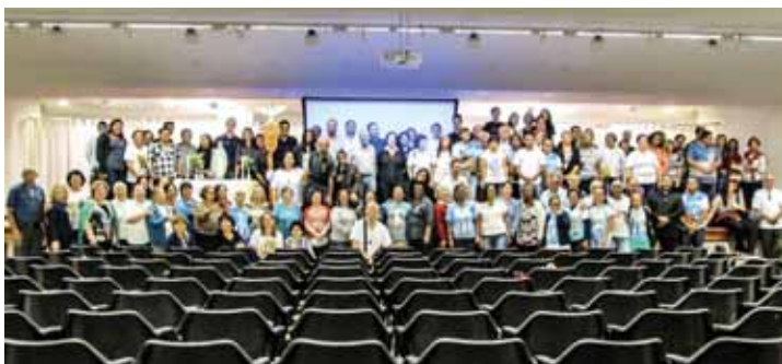
Foto dos Oficiais do Senatus e Regiae - Sexta Feira