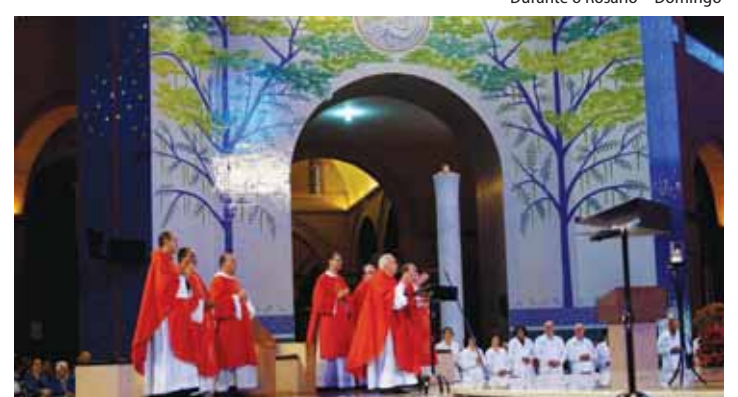
Celebração de Missa de Pentecostes 10 horas - Domingo