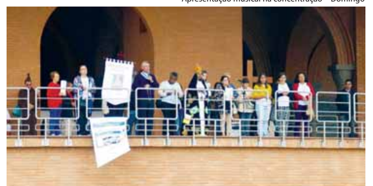
Tribuna durante o Rosário - Domingo