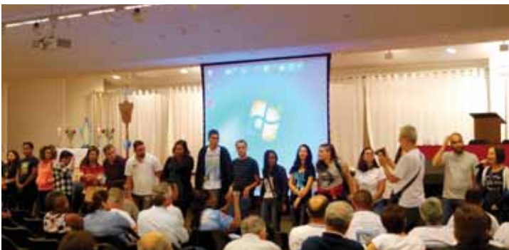
Jovens das Secretarias dos Senatus e Regiae - Sexta Feira