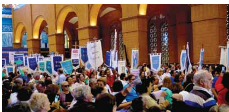
Estandartes entrando no Santuário - Sábado