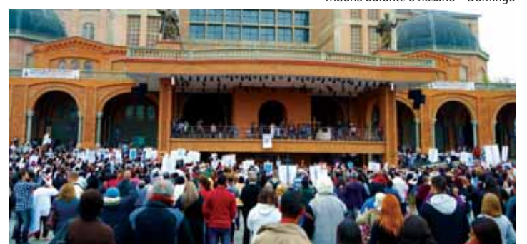
Durante o Rosário - Domingo