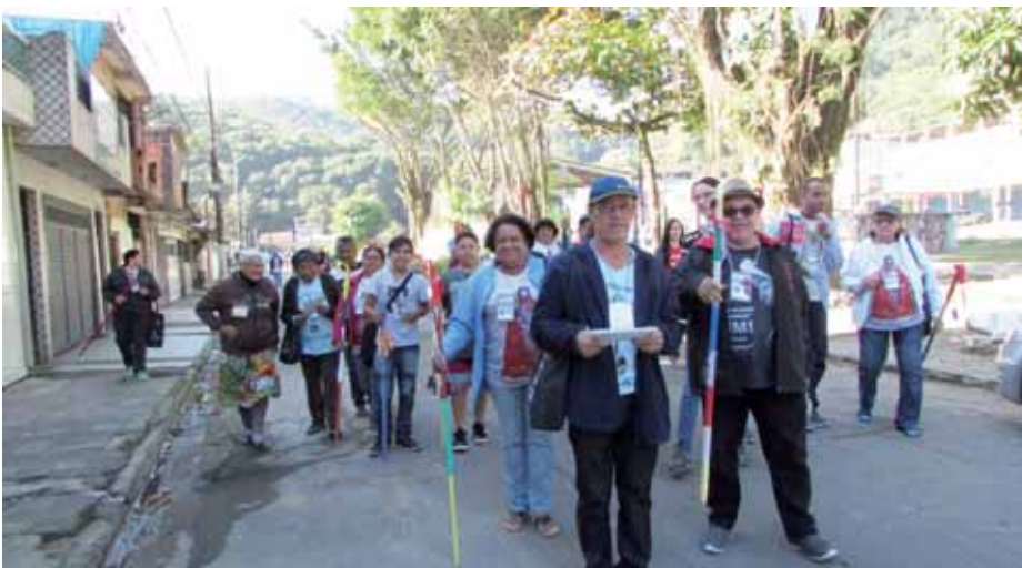
Saindo para o trabalho