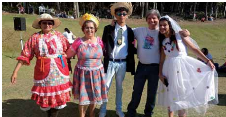
Oficiais do Senatus e os noivos da dança quadrilha