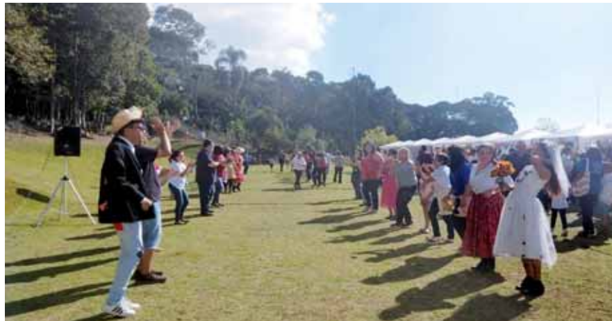
Dança da quadrilha