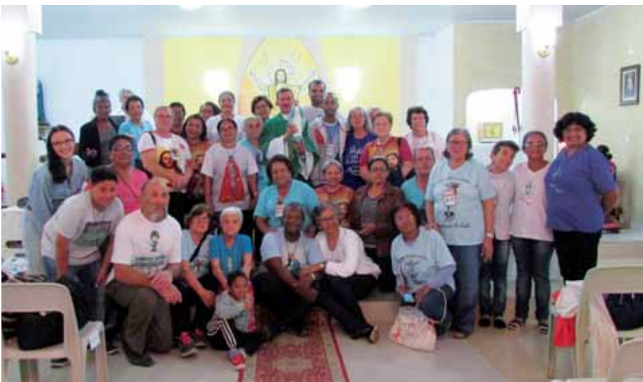
Grupo da PPC