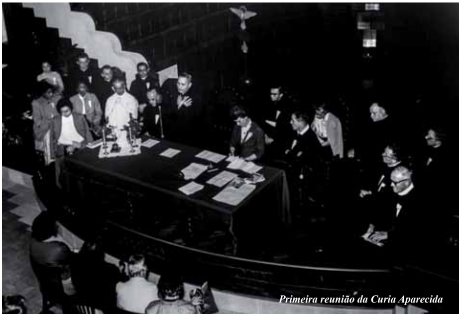
Primeira reunião da Curia Aparecida