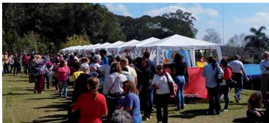
Baracas de comidas variadas