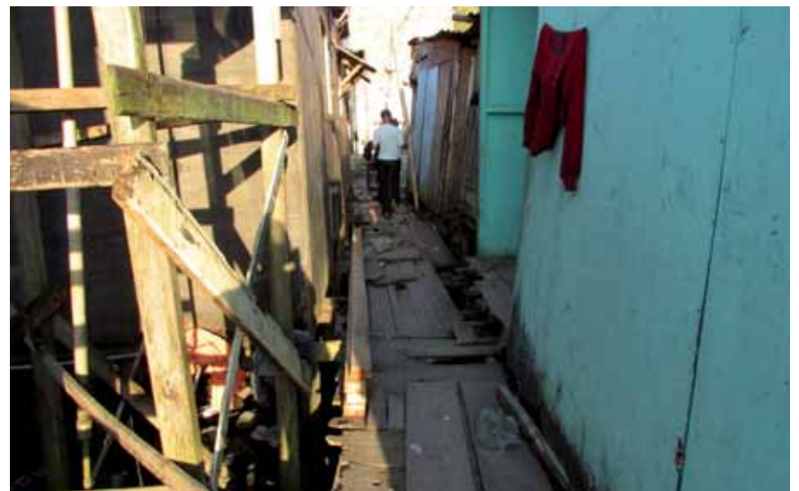
Locais onde visitamos