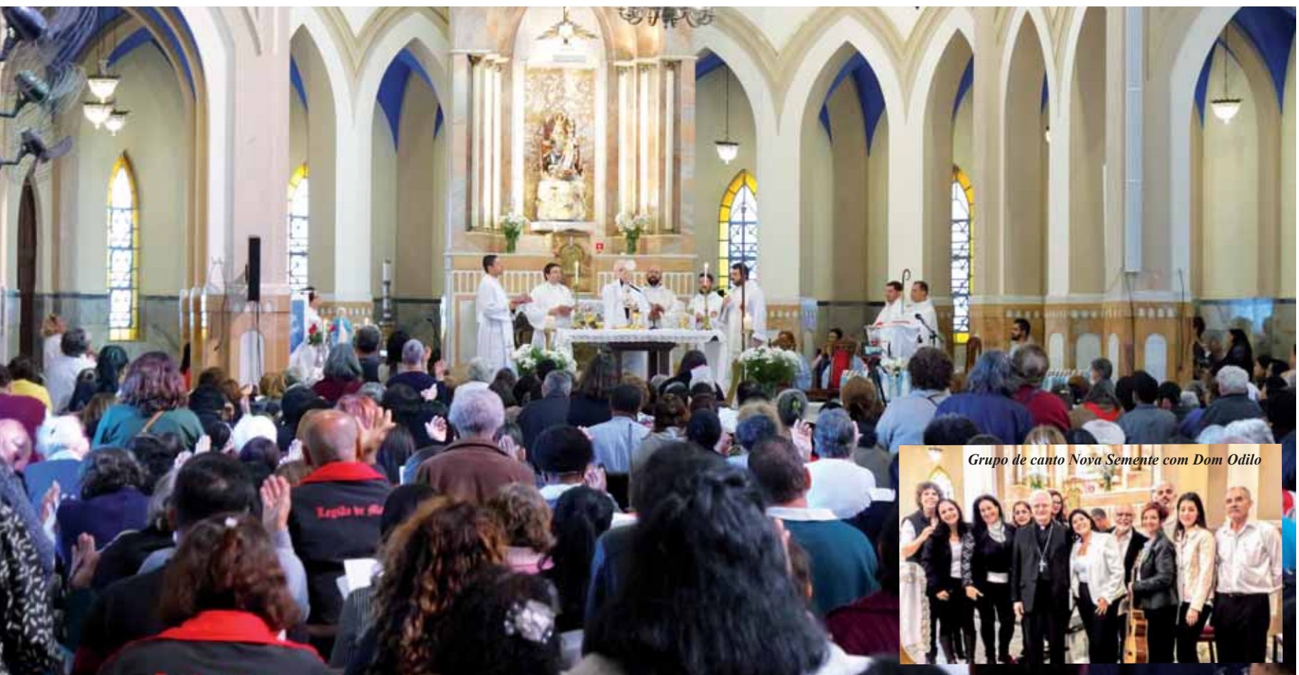
Grupo de canto Nova Semente com Dom Odilo