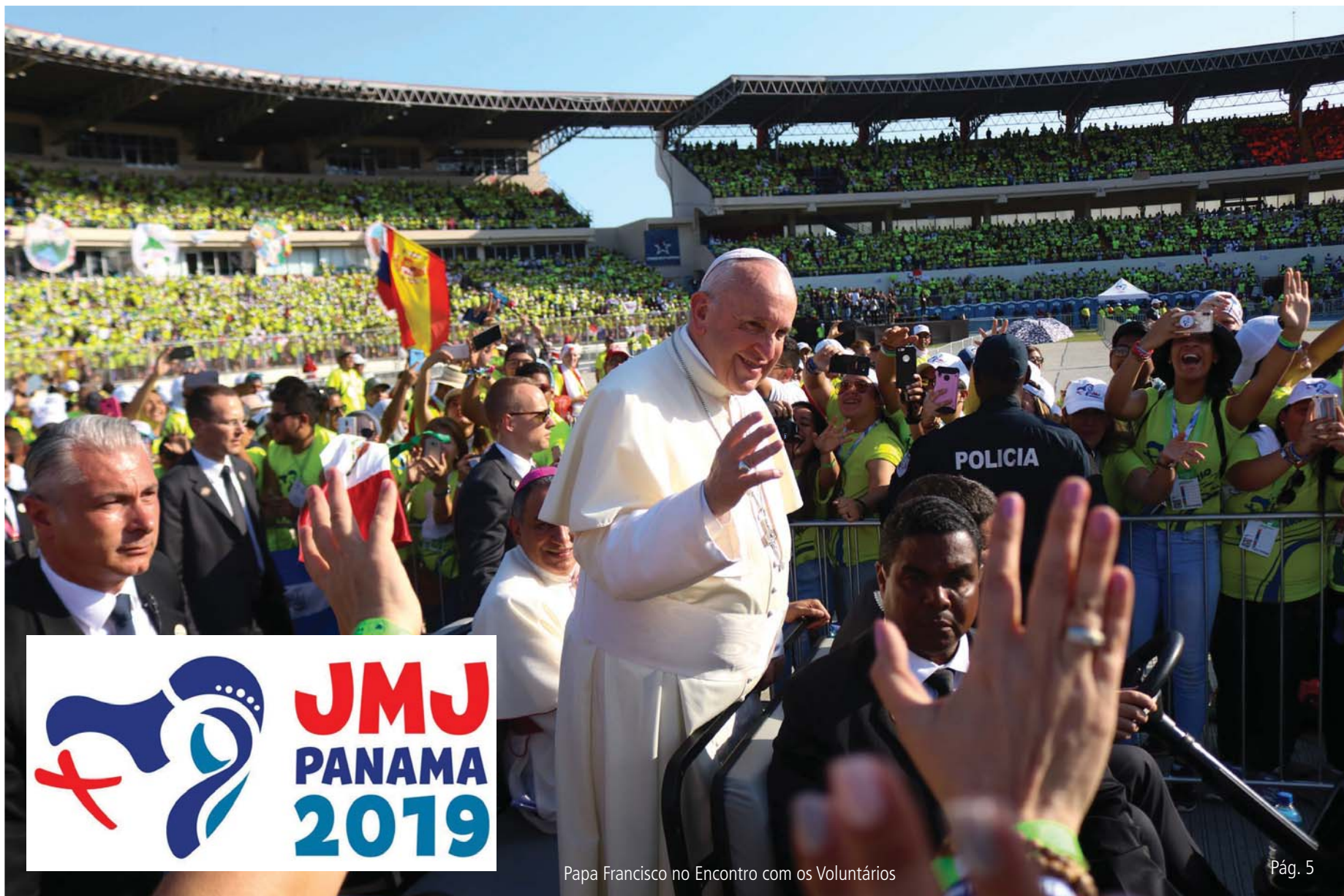
Papa Francisco no Encontro com os Voluntários