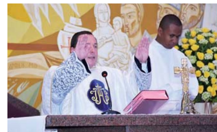
Imagem Peregrina em Taquaritinga - SP

Praesidium Nossa Senhora do Bom Conselho e Nossa Senhora de Fátima, filiada a Cúria Rainha dos Apóstolos, Comitium Magnificat de Taquaritinga, rezando nos lares com a imagem peregrina. Município de Santa Ernestina.