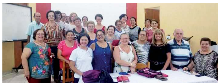
Imagem Peregrina em Cruzeiro - SP

Praesidium Nossa Senhora do Bom Conselho e Nossa Senhora de Fátima, filiada a Cúria Rainha dos Apóstolos, Comitium Magnificat de Taquaritinga, rezando nos lares com a imagem peregrina. Município de Santa Ernestina.