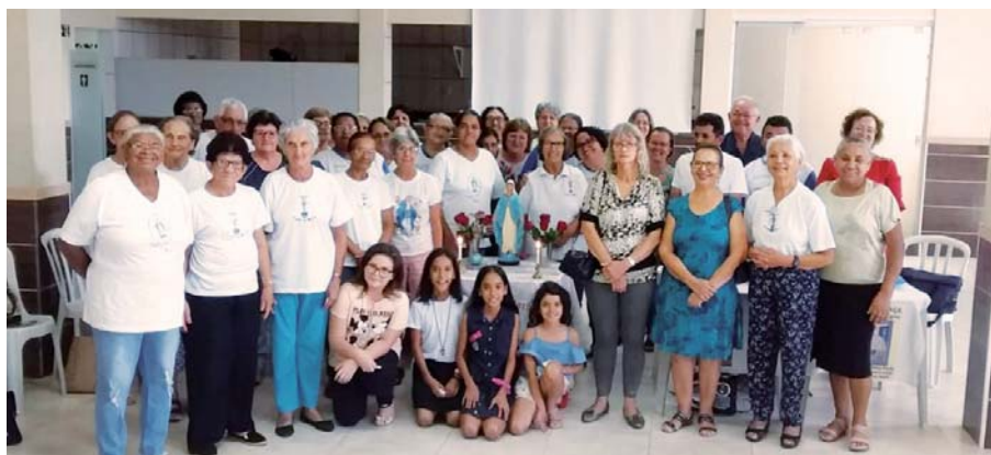
Imagem Mãe Peregrina em Mogi Guaçu - SP

A Curia, Maria Mãe da Igreja de Mogi Guaçu-SP, diocese de São João da Boa Vista-SP, realizou no dia 3 de Dezembro de 2019, a última reunião da Curia e a confraternização, onde pode agradecer a todos pelo ano de convivência e pedir, através da Virgem Maria, as graças e proteção de Deus para o ano de 2020."