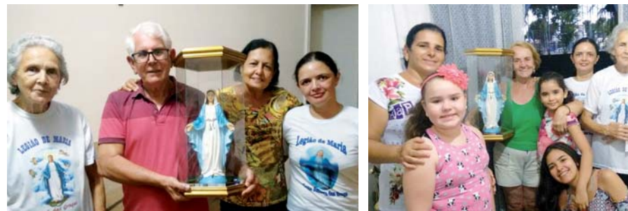
Imagem Peregrina em Cotia - SP

Continuamos firmes e fortes nesse trabalho incansável e missionário rumo ao Centenário da Legião de Maria em 2021. Deus seja louvado! Salve Maria!!!