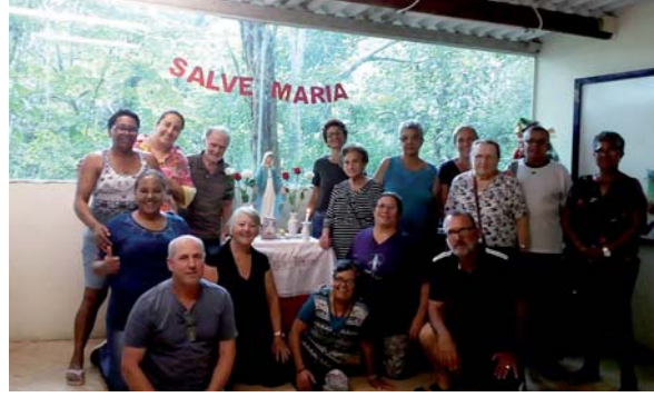
Imagem Peregrina em Taquaritinga - SP