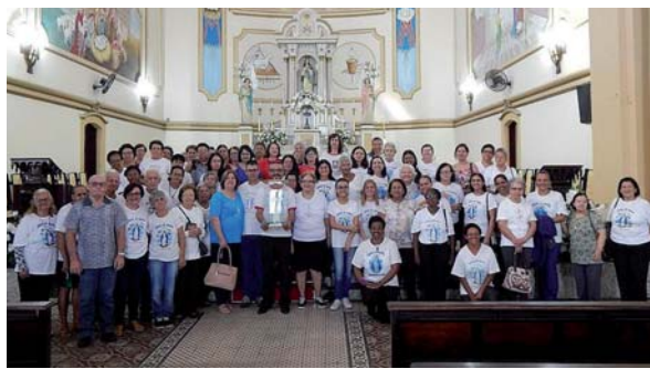
Imagem Peregrina em Praia Grande - SP

Dia 27/10/2019 o Comitium Puríssima acolheu a imagem peregrina de Nossa Senhora das Graças na Missa Solene às 07h na Matriz Imaculada Conceição com a participação das Curie Imaculado Coração de Maria e Assunta ao céu e grande número de legionários.