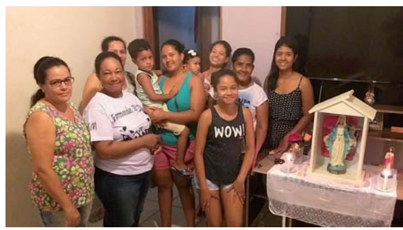
Imagem Peregrina em Cruzeiro - SP

Praesidium Nossa Senhora do Bom Conselho e Nossa Senhora de Fátima da Cúria Rainha dos Apóstolos, Comitium Magnificat de Taquaritinga, rezando nós lares com a imagem peregrina. Município de Santa Ernestina.