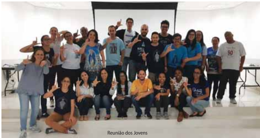
Reunião dos Jovens

Na sexta-feira que antecedeu a Romaria Nacional, dia 01/06/2018, enquanto os oficiais dos conselhos do Brasil estavam em reunião, jovens representantes das Secretarias da Juventude Legionária vindos de vários estados do país, reuniram-se na Sala dos Três Pescadores, no Santuário de Aparecida, para partilhar ideias e experiências, além de avaliar os trabalhos realizados e propor novas sugestões para a Juventude Legionária, que foram apresentadas e avaliadas no final da reunião dos oficiais dos Senatus e Regiae.