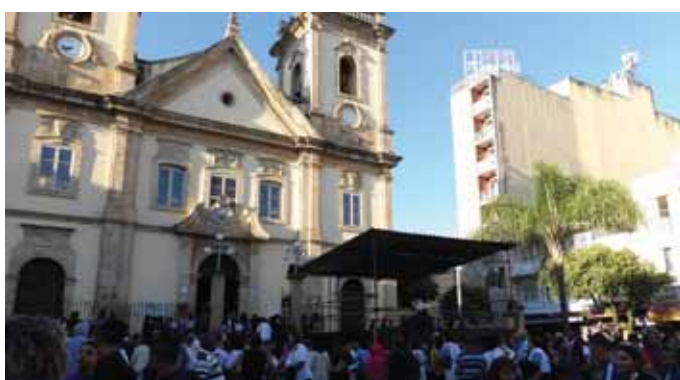
Concentração Basílica Velha