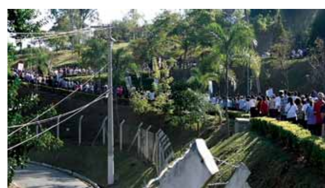
Via Sacra no morro do Cruzeiro