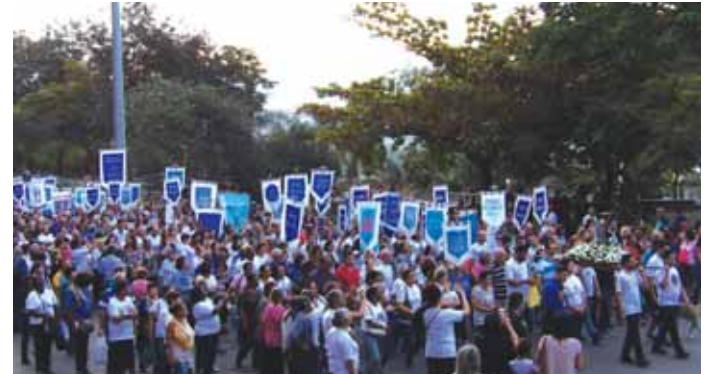
Procissão em volta da Basílica

animou no caminho. Quanta alegria! Deus seja louvado pela experiência vivida!