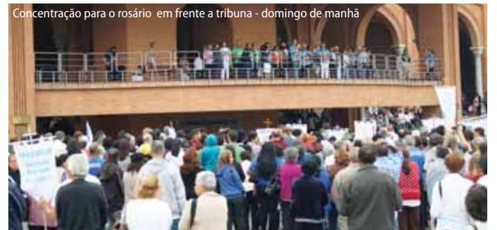
Concentração para o rosário em frente a tribuna - domingo de manhã