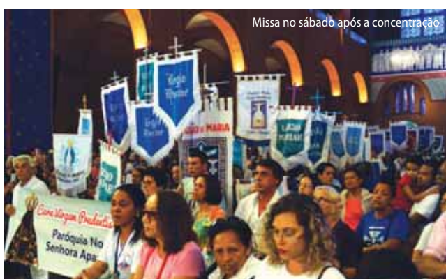
Missa no sábado após a concentração

Como é bom, como é agradável para os irmãos viverem unidos.” (Salmo 133,1) Sim, é maravilhoso cantarmos com o salmista a alegria de convivemos e darmos testemunho da unidade! E foi essa a experiência vivida nos últimos dias de 1 a 3 de junho de 2018, no Santuário Nacional de Aparecida, com a presença de Legionários vindos de todos os recantos do Brasil. Milhares de irmãos e irmãs, cada um com sua história, com suas alegrias e esperanças, dando testemunho de fé e alegria e representando tantos outros correligionários. São sementes poderosas plantadas no coração de cada um, que frutificarão abundantemente.