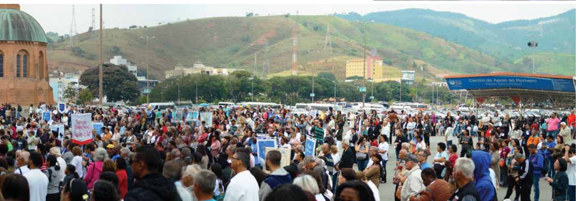
Concentração domingo de manhã