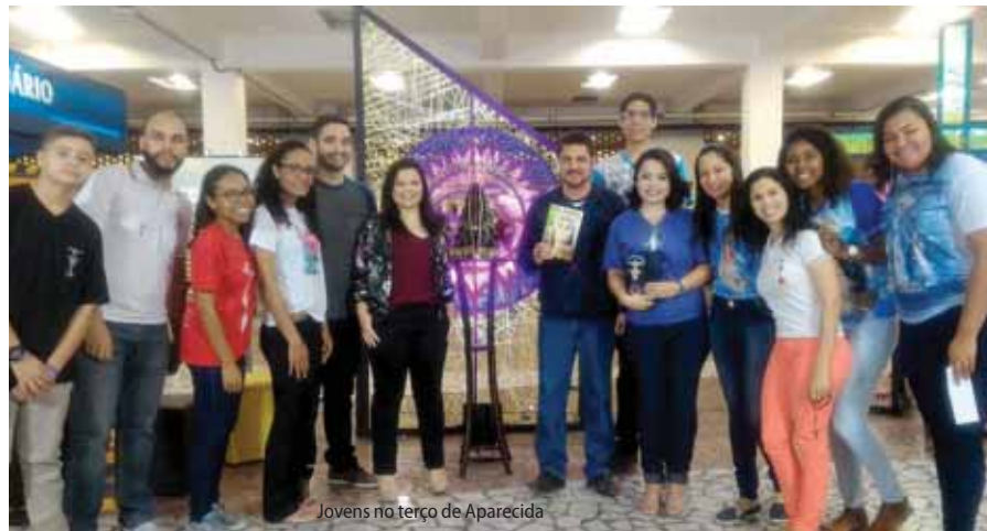
Jovens no terço de Aparecida

Os jovens conversaram sobre os seguintes assuntos: Vigília pela Juventude, que acontecerá nos dias 15 e 16 de setembro de 2018; sobre o 8º Encontro Nacional da Juventude Legionária (ENAJUL) - Brasília/DF em 2020; Jornada Mundial da Juventude (JMJ) 2019 no Panamá, com o objetivo