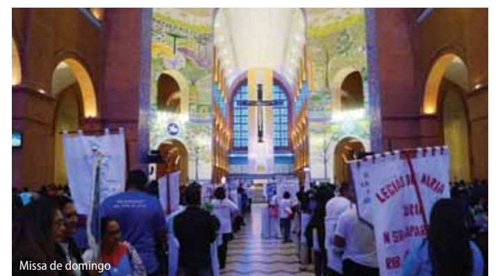
Missa de domingo