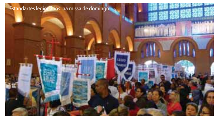
Estandartes legionários na missa de domingo