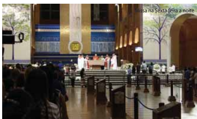
Missa na Sexta feira a noite