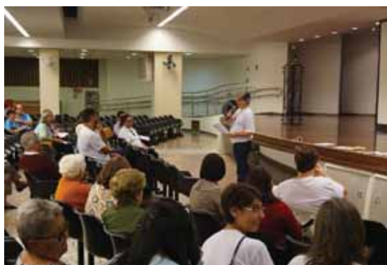
Reunião dos Senatus e Regiae